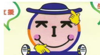
互助組合マスコットキャラクター

☆平成18年12月診療分まで →1,800円 ☆平成19年1月診療分から →3,000円 ※ 請求書をコピー化しました。